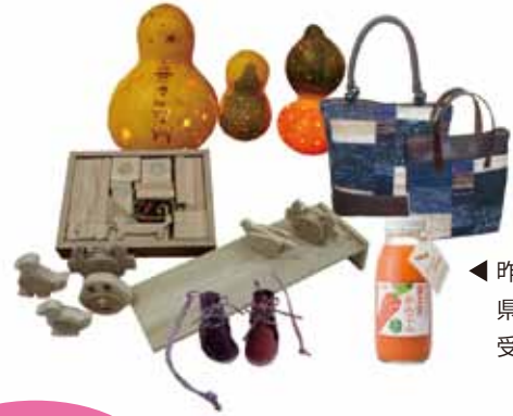
◀ 昨年の 県知事賞 受賞製品