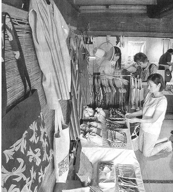
授産製品を手にする来場者＝磐田市の「花咲乃庄」で

磐田市宍貫地の国登録有形文化財の大善家住宅「花咲乃庄」二階ギャラリーで三十一日まで、障がいのある人の働く場で作られた製品の販売会が開かれている。