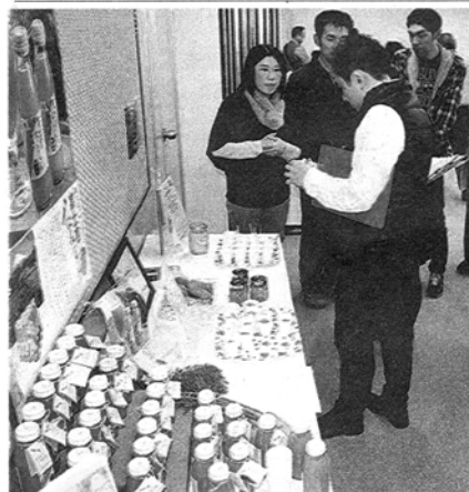
各福祉事業所が自慢の製品を出したコンクール＝静岡市葵区で

県内の福祉事業所が自主製品の出来栄を競う県授産製品コンクールが十日、静岡市葵区の「障害者働く幸せ創出センター」であった。製菓会社や雑貨店の経営者らが審査員になり、完成度や商品価値を採点。食品、布製品、木製品、雑貨品、作品の各部門の県知事賞などを選んだ。