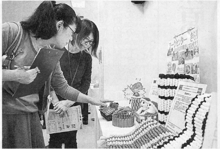
県授産製品コンクールで品質などを確認する審査員 ＝静岡市葵区

障害者らが工夫 授産製品を審査 5部門に64点 県内の福祉事業所の利用者らが作った製品を審査する県授産製品コンクール（NPO法人オールしずおかベストコミュニティ主催）