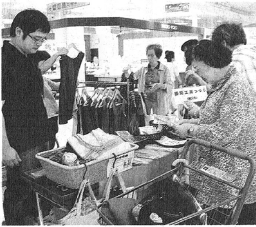
施設利用者が作った品を手取る買い物客ら＝袋井市上山梨のイオン袋井店で

障害者手作りのパンや雑貨並ぶ袋井で展示販売 障害がある人たちの手作り品を展示販売する「手づくり逸品福祉応援フェア」が四日、袋井市上山梨の大型商業施設イオン袋井店一階中央通路で始まった。五日も午前十時～午後五時まで開く。袋井市のなごみかぜ工房、ワークスつばさ、すずらん共同作業所、掛川市の好生会さわや家、掛川工房つじ、菊川市の草笛共同作業所、磐田市のたんぼぼ共同作業所、浜松市天竜区の作業所せきれいの八事業所が参加した。縫製品や木製品、雑貨、焼きたてパンにクッキー、野菜入りマフィンなど約二百種類を並べ、施設利用者がスタッフらと一緒に接客した。七夕飾りも用意し、買い物客が短冊に願い事を書いて飾る催しもある。障害者支援などをしているNPO法人オールしずおかベストコミュニティ（静岡市）が、イオンの協力で開いた。