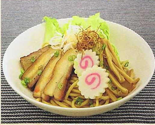
豚ばらチャーシューをあぶら一麺にアレンジ!