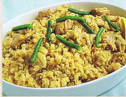
若鶏と大麦のサフラン煮込みをパエリアにアレンジ!

ホテル・レストランで使用されている商品を 解凍して温めるだけで簡単に自宅でお店の味を楽しめます 料理のプロの考えるアレンジレシピも大公開☆ メニューに悩んだら「いちまるマルシェ」へ! お気軽にご相談ください!