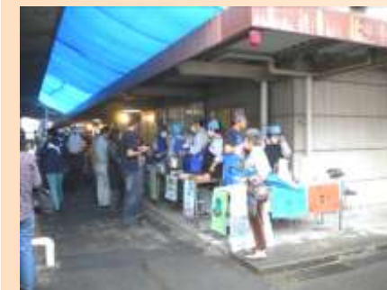
技能祭で模擬店運営